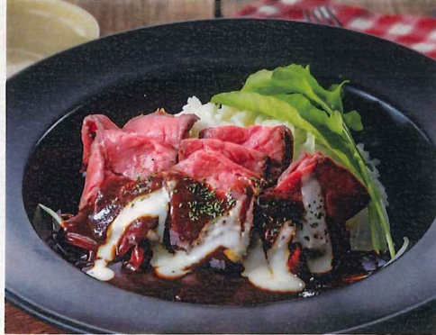
ローストビーフ丼 デミグラスソース 1,069円(税別 990円)