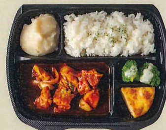
ビーフシチュー 赤ワイン煮込み 1,069円(税別 990円)