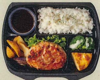
チーズインハンバーグ 961円(税別 890円)