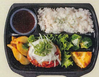
和風ハンバーグ 907円(税別 840円)