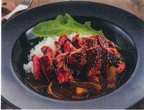
牛ハラミステーキ丼 マデラソース 1,177円(税別 1,090円)