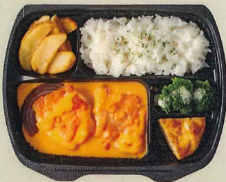
チキンのトマトクリームフォンデュ 799円(税別 740円)