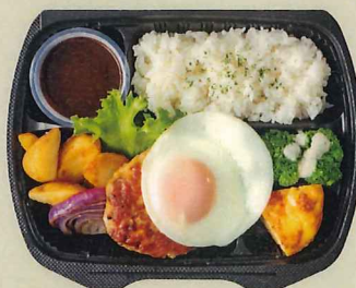
ロコモコ 961円(税別 890円)