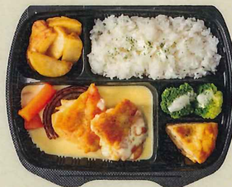
チキンのフリカッセ 853円(税別 790円)