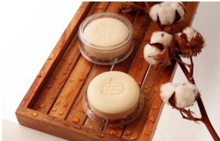
【エッセンシラス デポルトガル】

ファッションに情熱的な人のそれぞれのシーンに寄り添う、モード・ヴィンテージを軸としたオリジナルブランドが関西初出店！