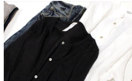
【ムモクテキ グッズアンドウェアーズ】

ポルトガルの自然な環境と、皮膚科医との共同開発によって生まれたオーガニック『固形石鹸』専門ブランド！